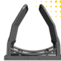
VUE DE DESSOUS

LA PBER (PINCE BALLES ENRUBANNAGE RONDES) est une pince spécialement conçue pour saisir et transporter des balles rondes d'enrubannage. Elle offre une prise solide tout en protégeant le film d'enrubannage, permettant un chargement et un déchargement faciles. La PBER est équipée de bras ajustables qui se referment autour de la balle, assurant une manipulation efficace et sans dommage. Le système hydraulique 1 vérin associé aux ressorts