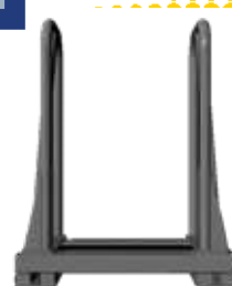
VUE DE DESSOUS