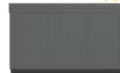
VUE DE DESSOUS