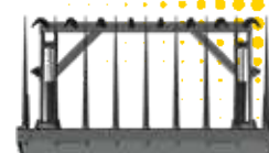
VUE DE DESSOUS

LE FC CROCODILE EST UNE FOURCHE À GRAPPIN spécialisée équipée de dents forgées. Ces dents forgées offrent une prise solide et stable sur les fumiers et les balles rondes ou carrées. La FC Crocodile est conçue pour une manipulation efficace des matériaux lourds tels que les fumiers épais. Les dents latérales assurent un bon maintien des produits. La qualité de sa structure autorise une grande durabilité de