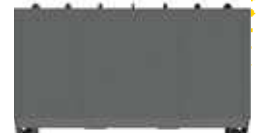
VUE DE DESSOUS