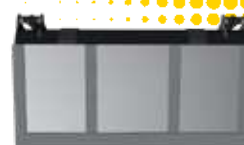
VUE DE DESSOUS