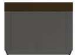
VUE DE DESSOUS

LE GODET À GRAPPIN MINI BMS est un accessoire compact, polyvalent pour les mini-chargeurs. Idéal pour manipuler des matériaux en vrac, pulvérulants comme fibreux. Il est équipé d'une griffe à dents oxycoupées, qui se ferme pour saisir et transporter efficacement les matériaux. Grâce à son vérin hydraulique, il permet une manipulation et un chargement précis et offre une meilleure sécurité en maintenant fermement les matériaux. En résumé, le godet à grappin mini chargeur est un outil pratique obligatoire. Cette BMS multifonctions se distingue par son poids