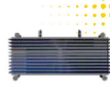
VUE DE DESSOUS

LE BAL (BALAI POUSSEUR) est un équipement de manutention utilisé pour nettoyer les surfaces en poussant les débris, la neige, la boue ou d'autres matériaux. Il est conçu pour être monté sur des fourches de levage (mais peut aussi en option avoir une fixation euro). Le BAL est doté de brosses robustes qui balayent efficacement les débris, tandis que les fourches le maintiennent en place et lui donnent